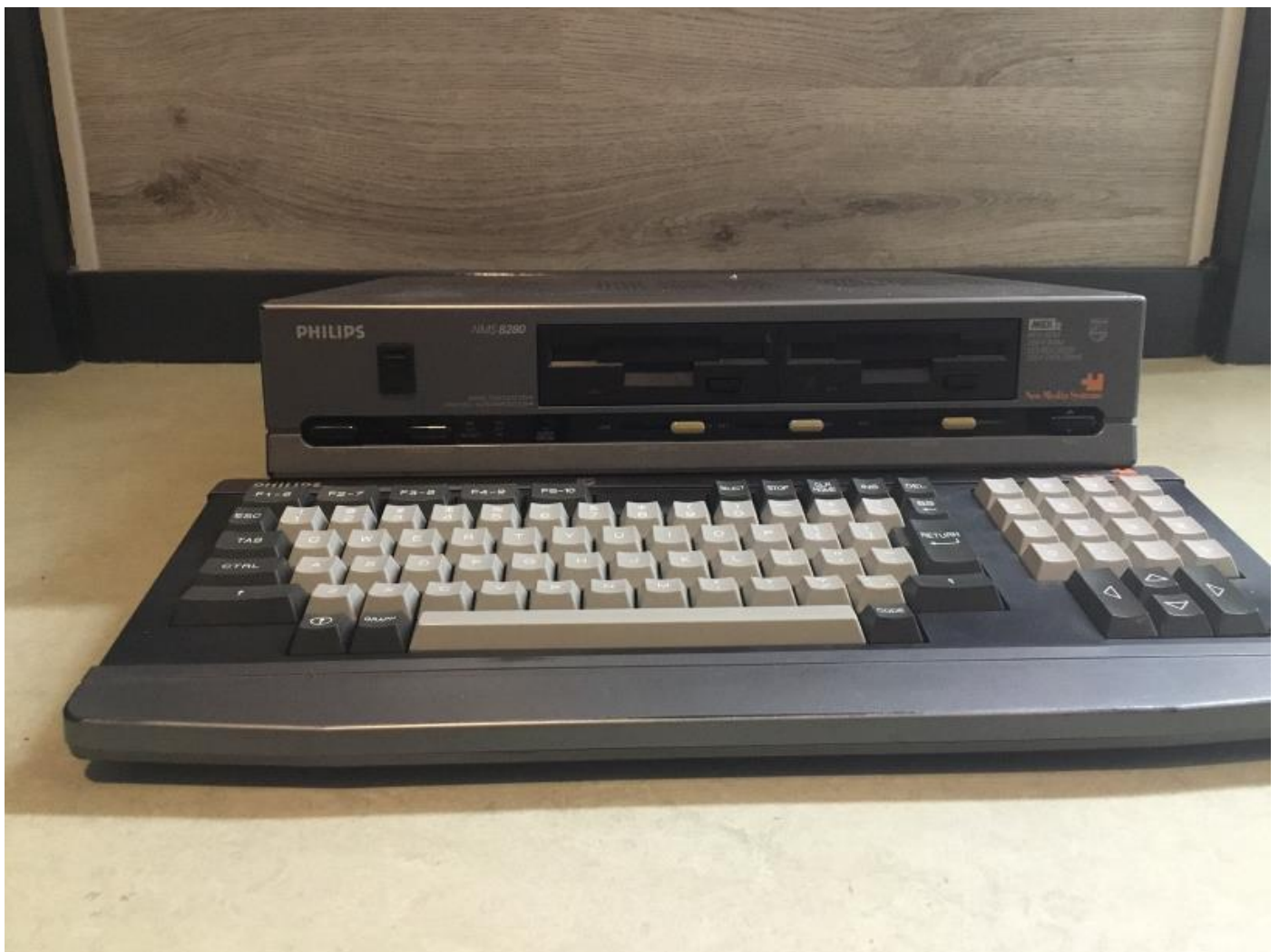
De Philips NMS 8280 MSX-2 computer.